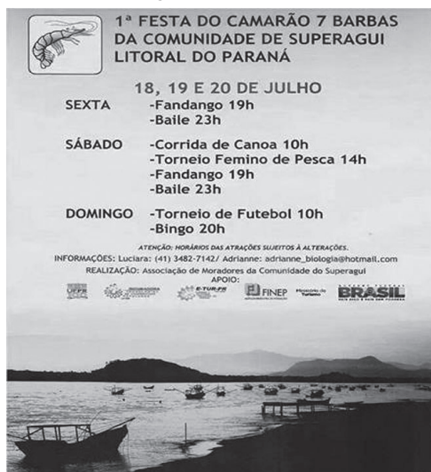
Figura 2 – Cartaz de divulgação da 1ª Festa do Camarão de Superagüi

O projeto contribuiu com a formação de agentes locais fazendo surgir lideranças em prol do bem comum. Exemplo foi a realização da “1ª Festa do Camarão 7 Barbas da Comunidade do Superagüi” (Figura 2) realizada entre os dias 18 e 20 de julho de 2014, surgida da cooperação entre liderança local e ITCP.